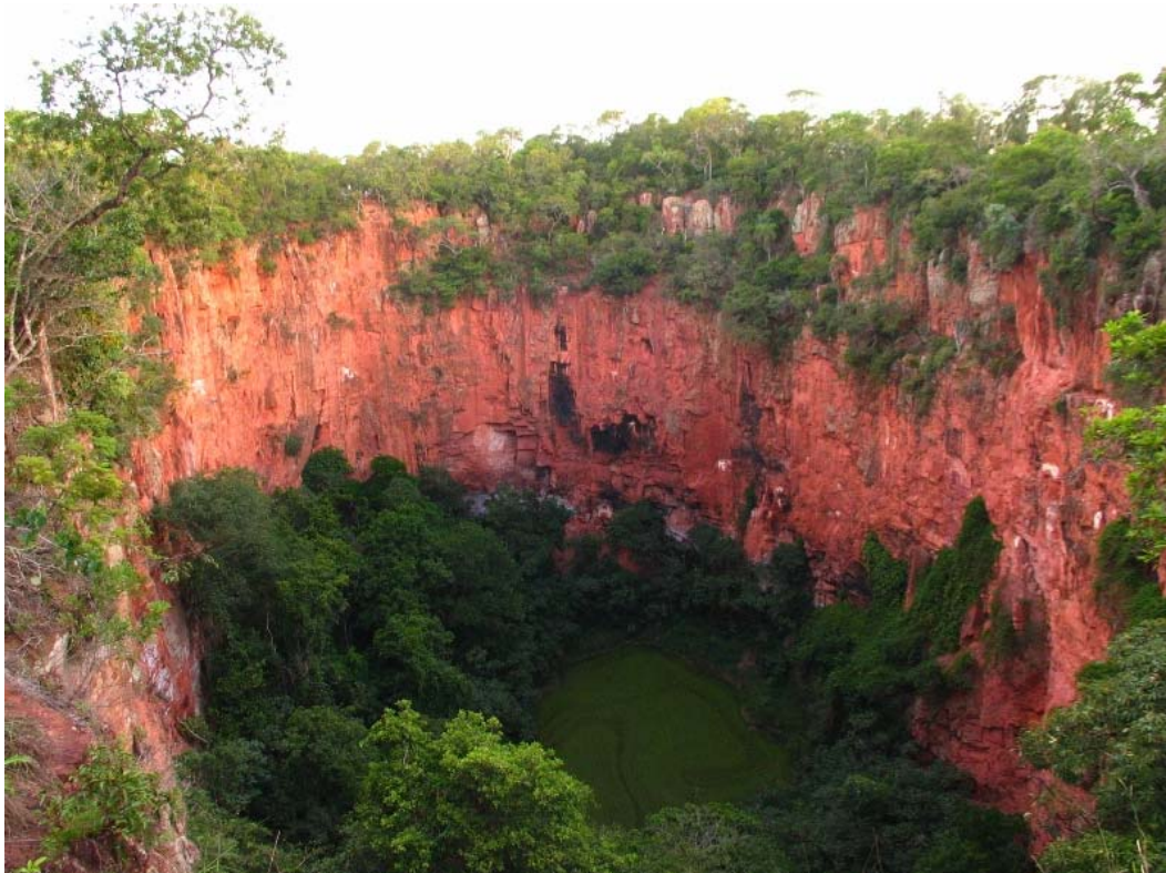
FIGURA 12. Buraco das Araras (Bonito/MS), sítio turístico caracterizado como uma dolina, depressão circular decorrente da dissolução do substrato calcário