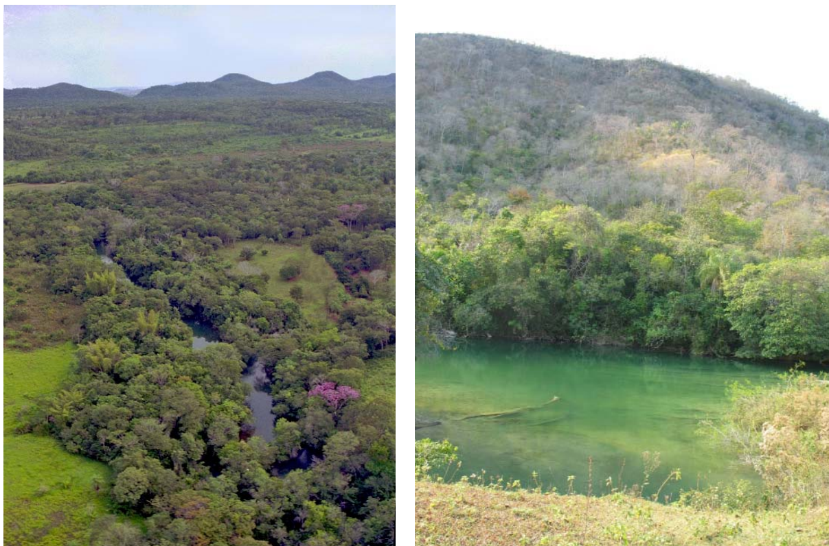
FIGURA 7. Vista aérea de parte do vale do rio Formoso (Bonito/MS), mostrando as elevações do Planalto da Bodoquena (ao fundo) e a várzea com a floresta de galeria, miscigenada com banhados (esq.). À direita, as margens do rio Salobra (Bodoquena/MS), e a floresta decidual da encosta, ladeada pela mata ciliar