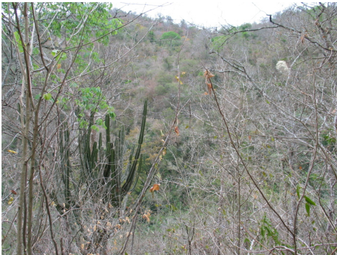
FIGURA 13. Aspecto da "mata seca", ou floresta estacional decidual, e a acentuada caducifolia da maior parte das árvores, que a caracteriza (Fazenda Rancho Branco).