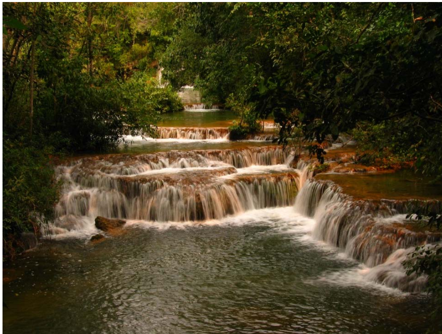
FIGURA 10. Desníveis fluviais e quedas d'água decorrentes do depósito de tufas calcárias, peculiares da região da Serra da Bodoquena (Cachoeira da Água Doce, rio Mimoso, Bonito/MS).