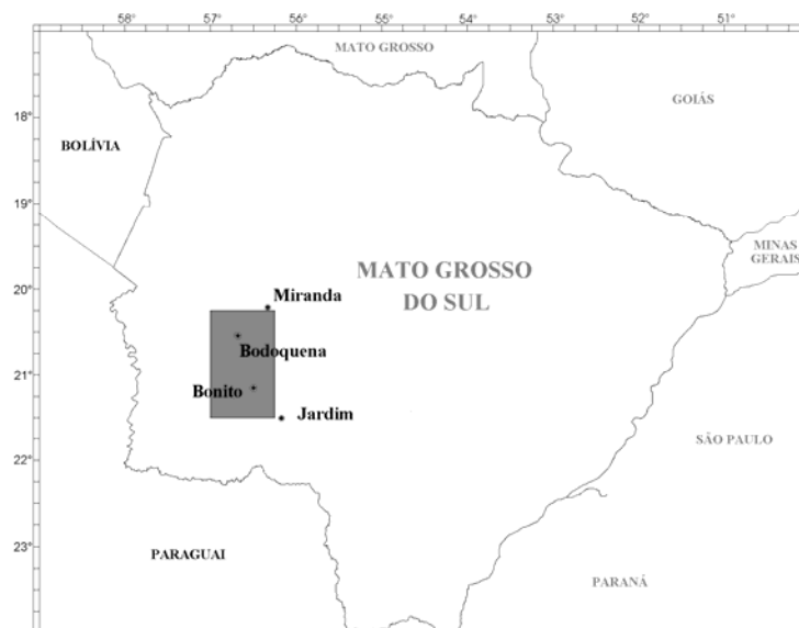
FIGURA 1. O Estado do Mato Grosso do Sul e, em destaque, o quadrante onde se insere a área de estudo, com indicação das sedes municipais mais importantes.