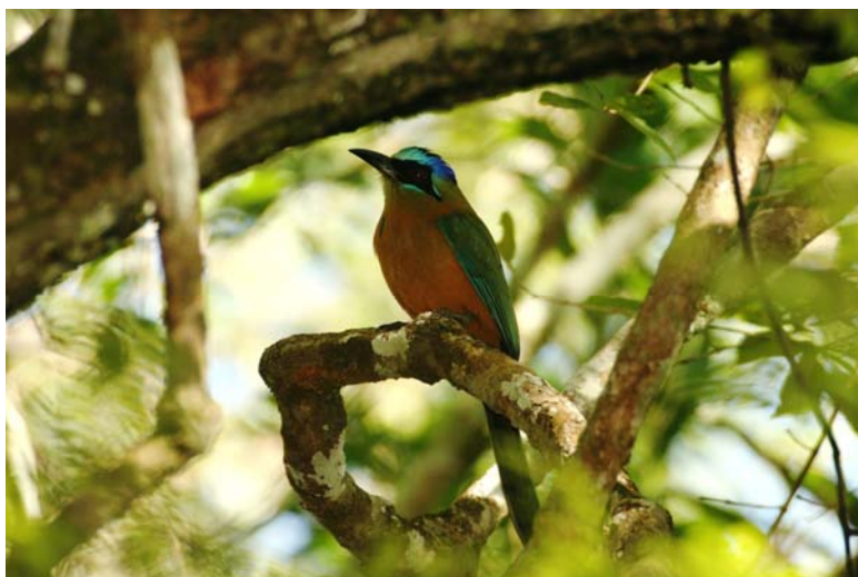
FIGURA 5. Momotus momota , típico representante florestal na área de estudo

Apesar da proximidade geográfica, várias espécies comuns ou peculiares à região denominada Pantanal, são raras ou mesmo ausentes no Planalto da Bodoquena, o que vem a sugerir uma gradação altitudinal, facilmente notável nas porções mais setentrionais da área de estudo. Nesse sentido, a apresentação de táxons tipicamente pantaneiros passa a ser percebida e marcante, por exemplo, em direção norte, ao longo das rodovias MS-178 (Bonito-Bodoquena) e MS-339 (Bodoquena-Miranda). E isso é notável não somente entre as espécies aquáticas ( Dendrocygna autumnalis , Theristicus caerulescens , Platalea ajaja , Jabiru mycteria , Mycteria americana , Phaetusa simplex e Rynchops niger ) como seria de se esperar, mas também as que preferem habitats semi-abertos ou em regeneração ( Uropelia campestris , Primolius auricollis , Nandayus nenday , Podager nacunda , Formicivora rufa , Paroaria capitata e Agelasticus cyanopus ) ou florestais próximos de corpos d'água ( Pandion haliaetus , Rostrhamus sociabilis , Buteogallus urubitinga , Cercomacra melanaria , Synallaxis albilora , Pseudoseisura unirufa , Phacellodomus ruber e Thryothorus guarayanus ).