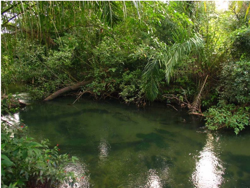
FIGURA 11. Mata ciliar nas nascentes do rio Formoso, associada a córrego com embasamento calcário (Fazenda América, Bonito/MS).