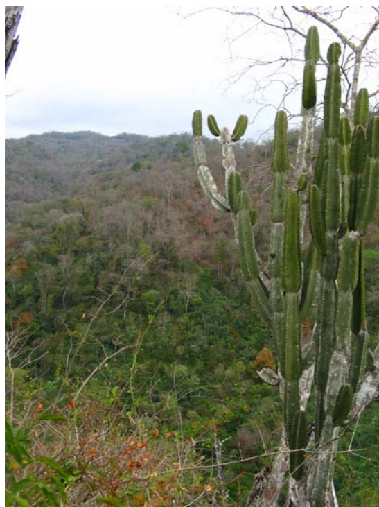
FIGURA 14. Aparência da floresta decidual (Fazenda Rancho Branco, Bodoquena/MS), com abundante tapete de folhas secas e o típico substrato rochoso, com solo superficialmente restrito às saliências das rochas (esq.) À direita, detalhe da paisagem florestal típica do Planalto da Bodoquena, bem como o seu caráter xérico, formando composição com florestas semidecíduas e decíduas (Fotos: Maria Antonietta Castro Pivatto).