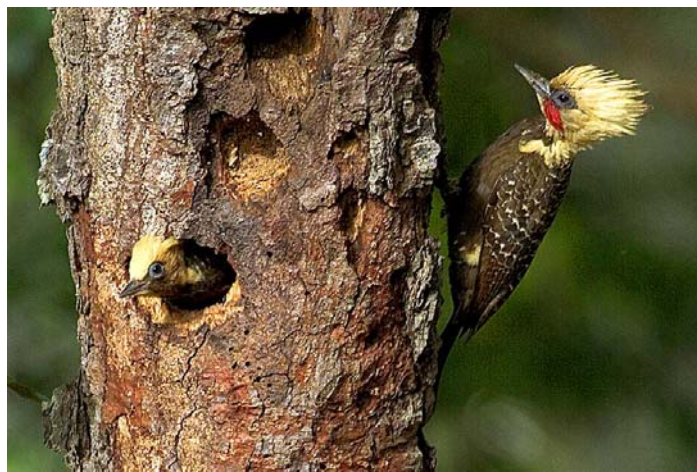
FIGURA 4. Celeus lugubris , espécie de distribuição centrada no Planalto da Bodoquena e adjacências do Pantanal, além da Bolívia, Paraguai e Argentina (Foto: Daniel De Granville Manço).

Já a Pseudoseisura unirufa relaciona-se com P.cristata , espécie peculiar da caatinga e periferia (Zimmer & Whittaker, 2000). Outros na mesma situação biogeográfica, dependem de análises mais detalhadas de parentesco, ainda que os táxons afins pareçam mais do que óbvios. Campylorhynchus turdinus unicolor , evidente merecedor de split para espécie plena, associa-se a C.t.turdinus do Brasil este-setentrional (Selander, 1964), ambos