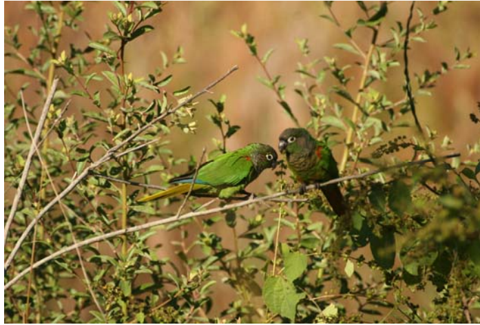
FIGURA 3. Pyrrhura devillei , uma das espécies de psitacídeos mais comuns no Planalto da Bodoquena.