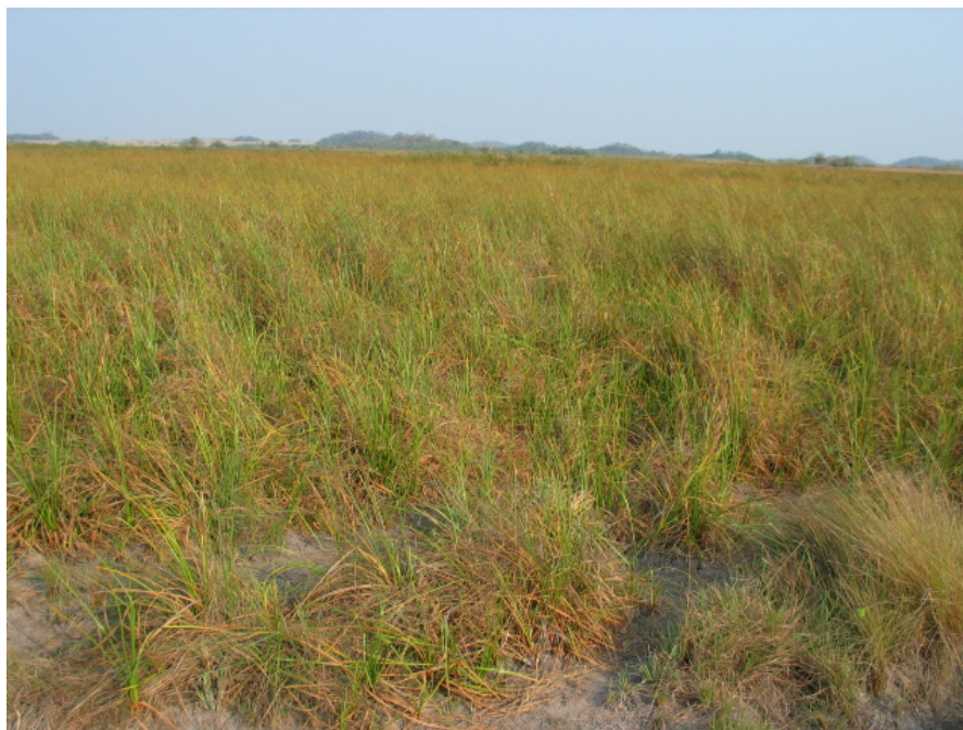
FIGURA 8. Típica formação aberta, sazonalmente inundável, na várzea do rio Perdido (Bonito/MS), marginalmente alterada pelo gado